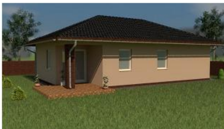
Nízkoenergetický dům (79 m 2 ) za 1.650.000,-CZK (bez DPH).

Služby ve výstavbě | Projektová činnost | Stavební dozor |